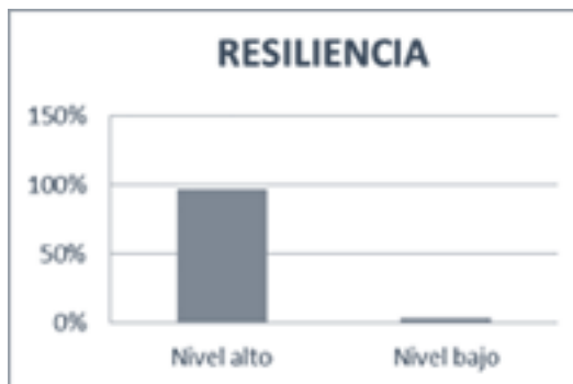
Gráfico 3. Porcentaje del nivel de resiliencia en mujeres maltratadas

Otro de los objetivos es identificar el nivel de resiliencia que tienen estas mujeres, a fin de identificar la relación que existe entre maltrato en pareja y resiliencia. A continuación se muestran los resultados obtenidos respecto al nivel de resiliencia en 236 mujeres que participaron en la investigación.