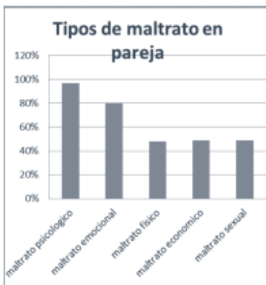
Gráfico 2. Porcentaje de los tipos de maltrato en pareja

El maltrato en pareja es de diferentes tipos: económico, sexual, psicológico, físico y emocional. A continuación se muestran los resultados de cada uno de los tipos de maltrato, con su análisis.