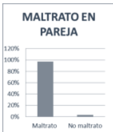
Gráfico 1. Porcentaje de maltrato en pareja.

Uno de los principales objetivos de esta investigación fue conocer el nivel de maltrato presentado en la muestra seleccionada; se encontró que el 7% de las mujeres manifestaron no haber sido maltratadas por su pareja. Es decir que el 93% expresó haber sido maltratadas de alguna forma por su pareja.