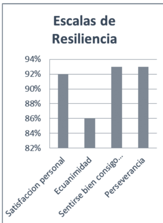
Gráfico 4. Porcentaje de escalas de resiliencia

Existen diferentes escalas, según Wagnild & Young (1993), que miden la resiliencia. A continuación se muestran los resultados de acuerdo con las diferentes escalas.